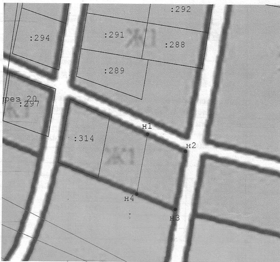
Масштаб 1:2 000